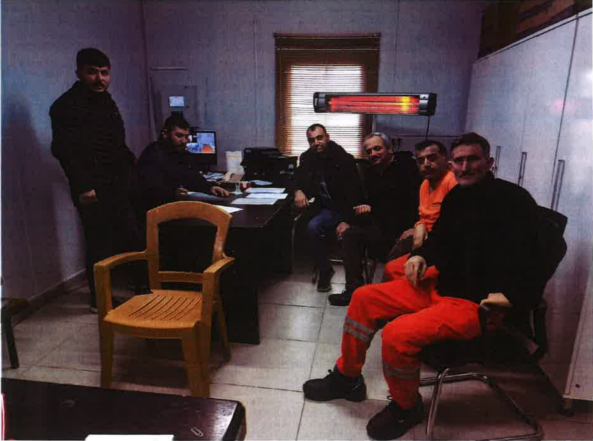
-14.03.2024 Tarihli ADR Farkındalık Eğitimi Fotoğrafları-