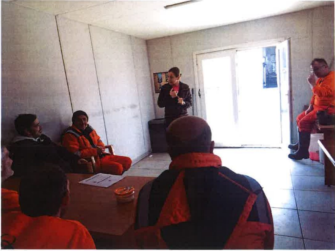
-15.03.2022 Tarihli Tıbbi Atık Konulu Eğitim Fotoğrafi-