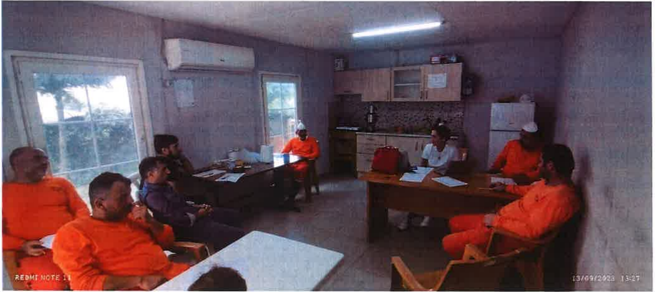
-13.09.2023 Tarihli İş Sağlığı ve Güvenliği Konulu Eğitim Fotoğrafları-