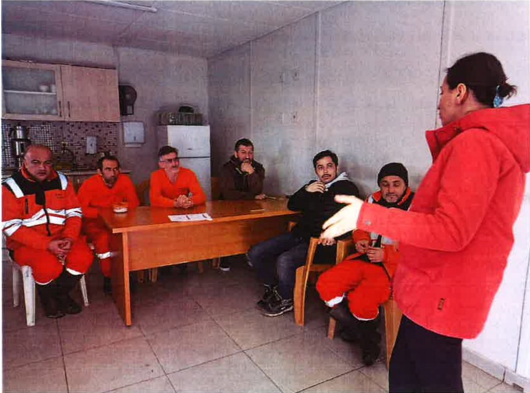
-05.02.2024 Tarihli Çevre Eğitimi Fotoğrafları-