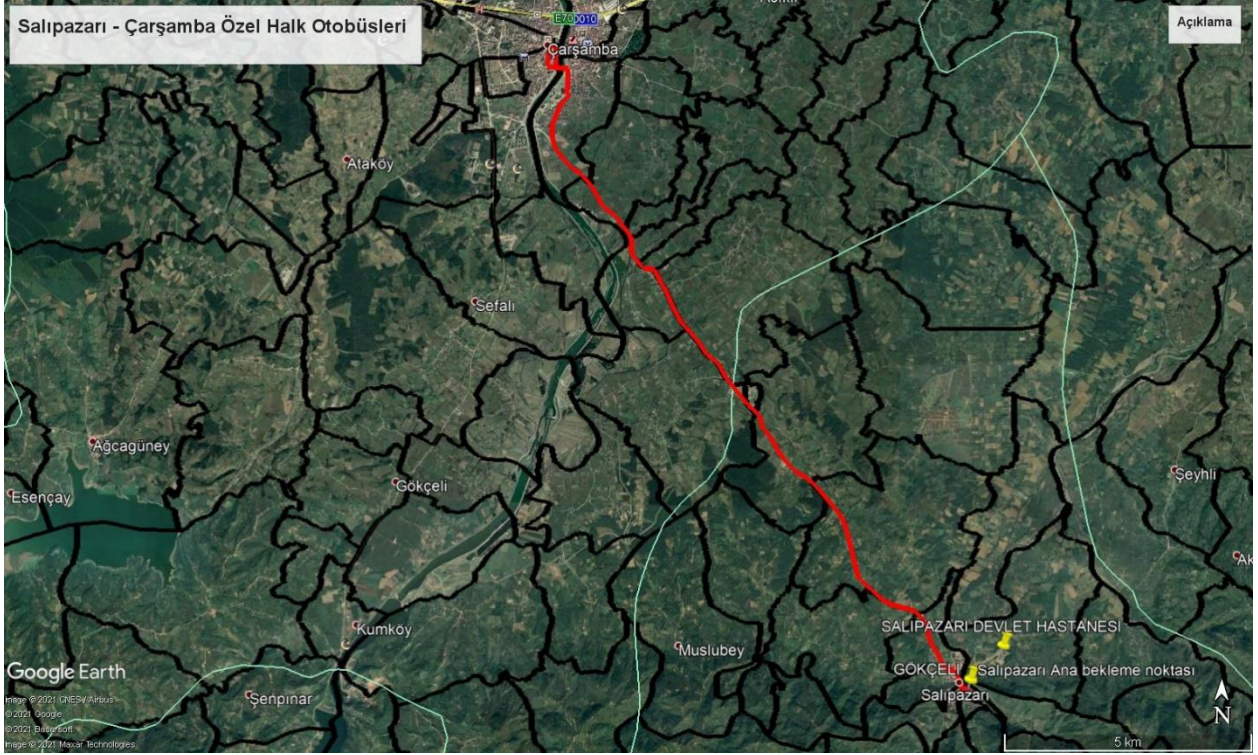
Şekil 2: Salıpazarı-Çarşamba Özel Halk Otobüsü Hattı Güzergâhı

Salıpazarı ve Çarşamba ilçeleri arasında aşağıdaki şekilde belirtilen güzergâh üzerinde çift yönlü yarım saat sefer aralığıyla hizmet verilmektedir.