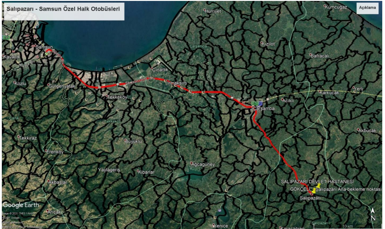
Şekil 1: Salıpazarı-Samsun Özel Halk Otobüsü Hattı Güzergâhı

Salıpazarı ilçesi Samsun kent merkezi arasında aşağıdaki şekilde belirtilen güzergâh üzerinde çift yönlü bir saat sefer aralığıyla hizmet verilmektedir.